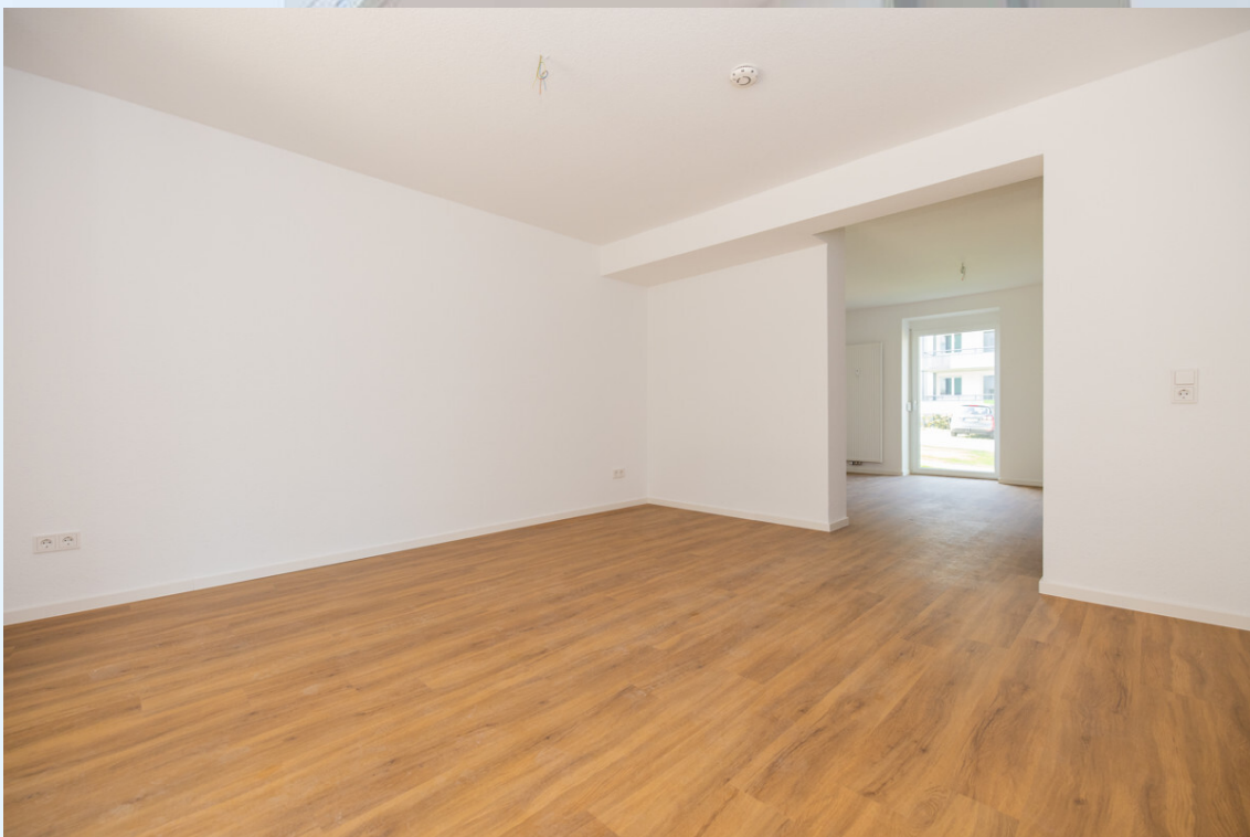
Durchgang Wohnzimmer in Küche