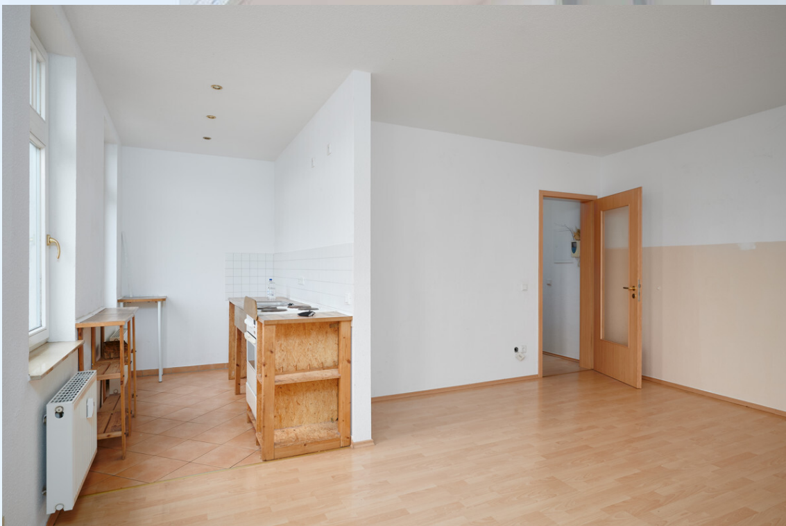
Wohnzimmer + Küche