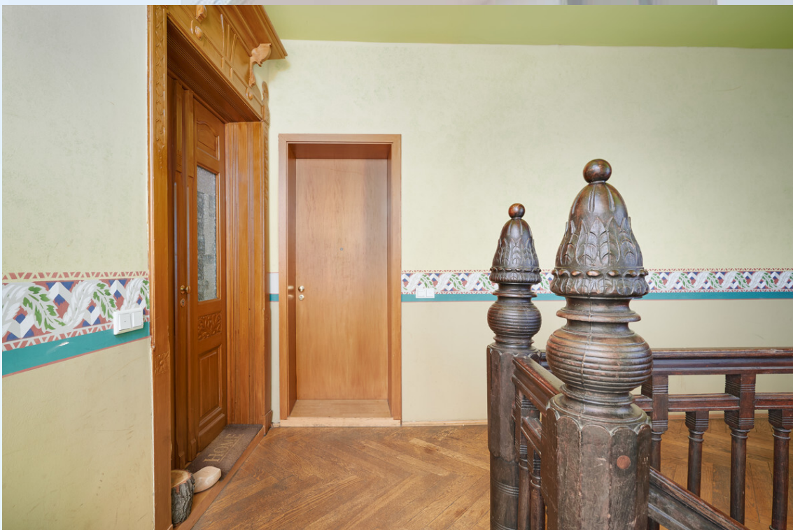
Eingang zur Wohnung