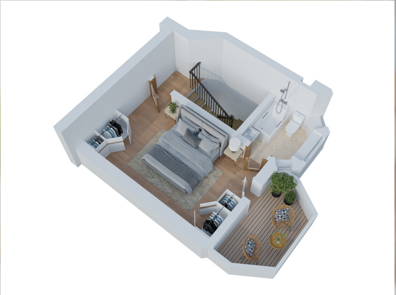
3D Grundriss 2. Stock