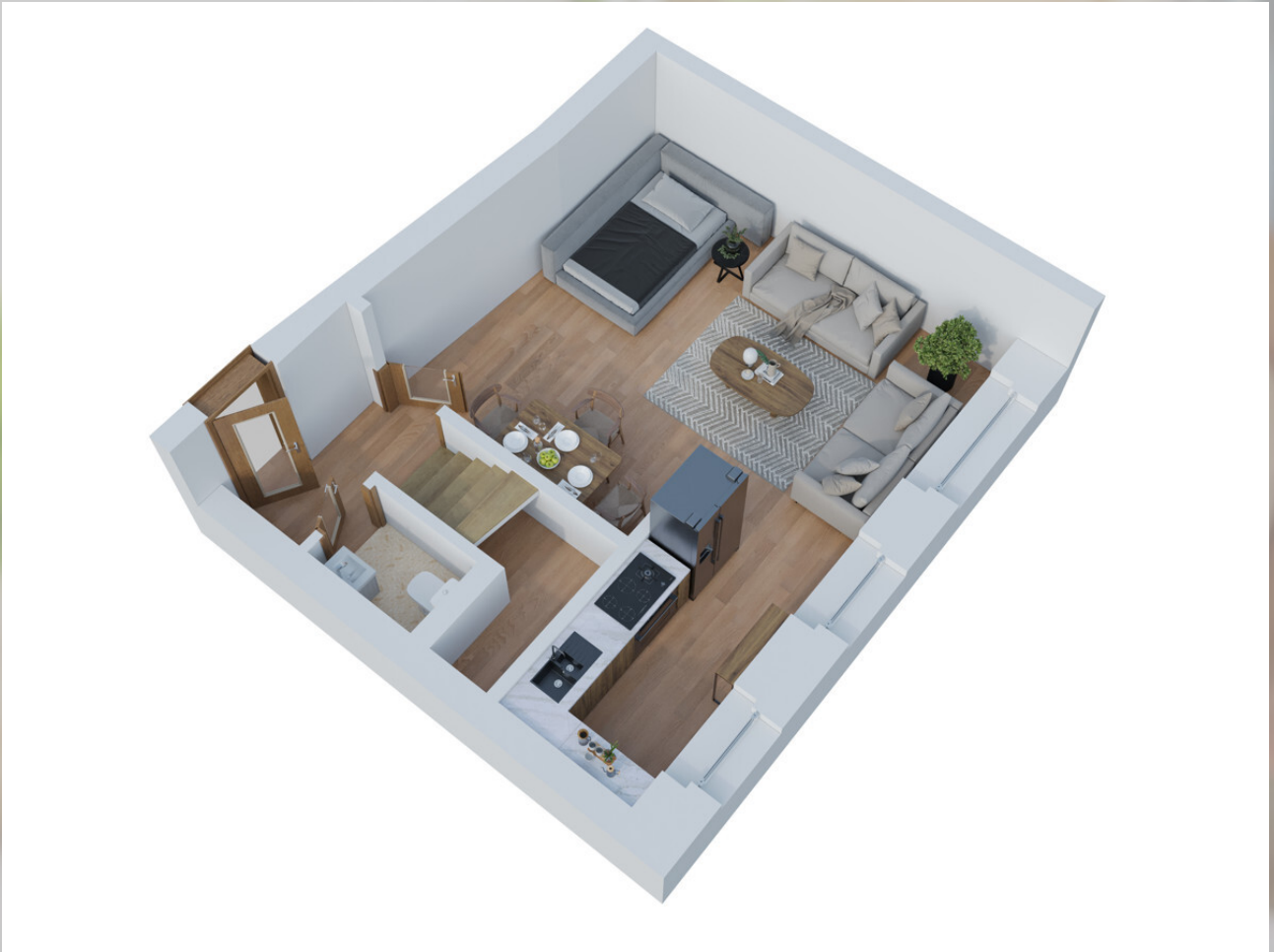
3D Grundriss 1. Stock