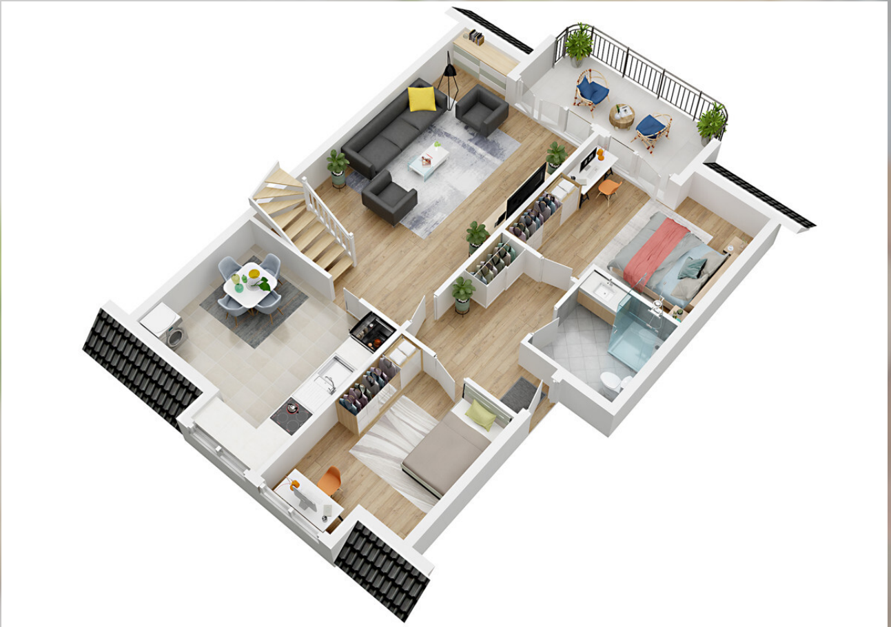
3D Grundriss 1. Stock