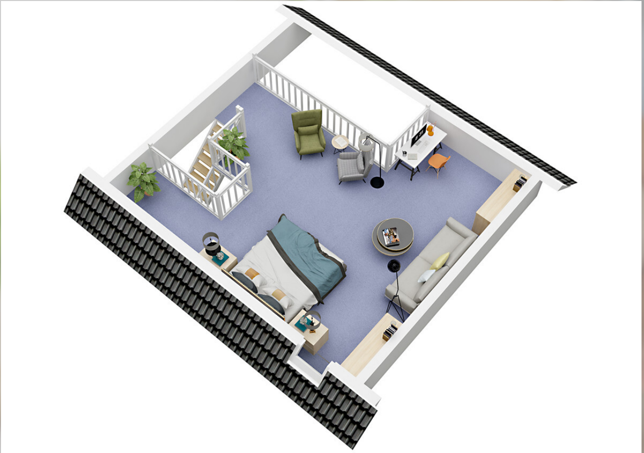
3D Grundriss 2. Stock