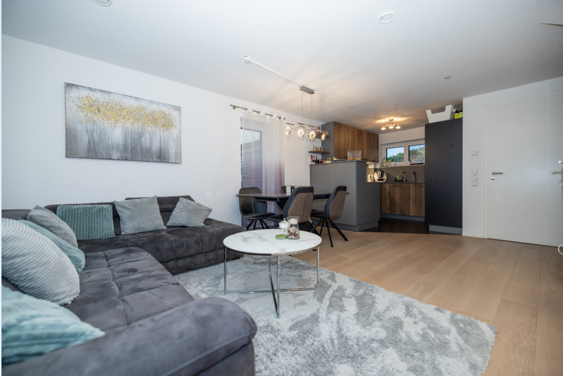
Wohn- und Esszimmer