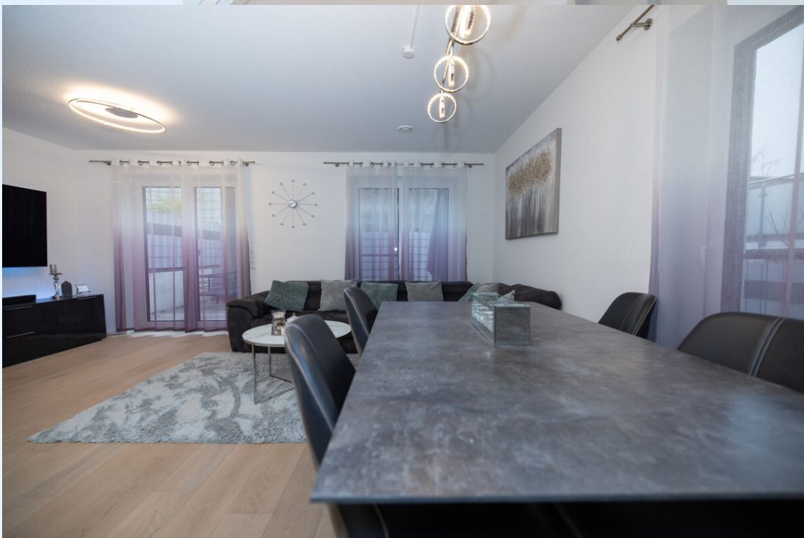
Wohn- und Esszimmer