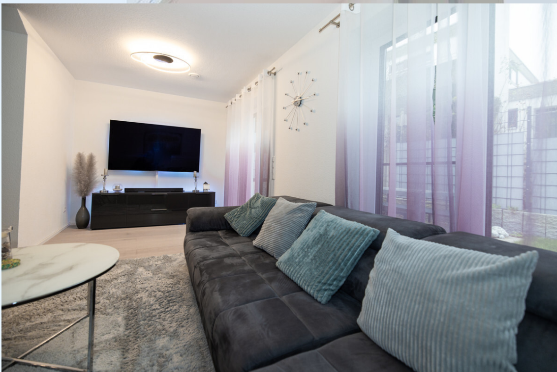
Wohn- und Esszimmer