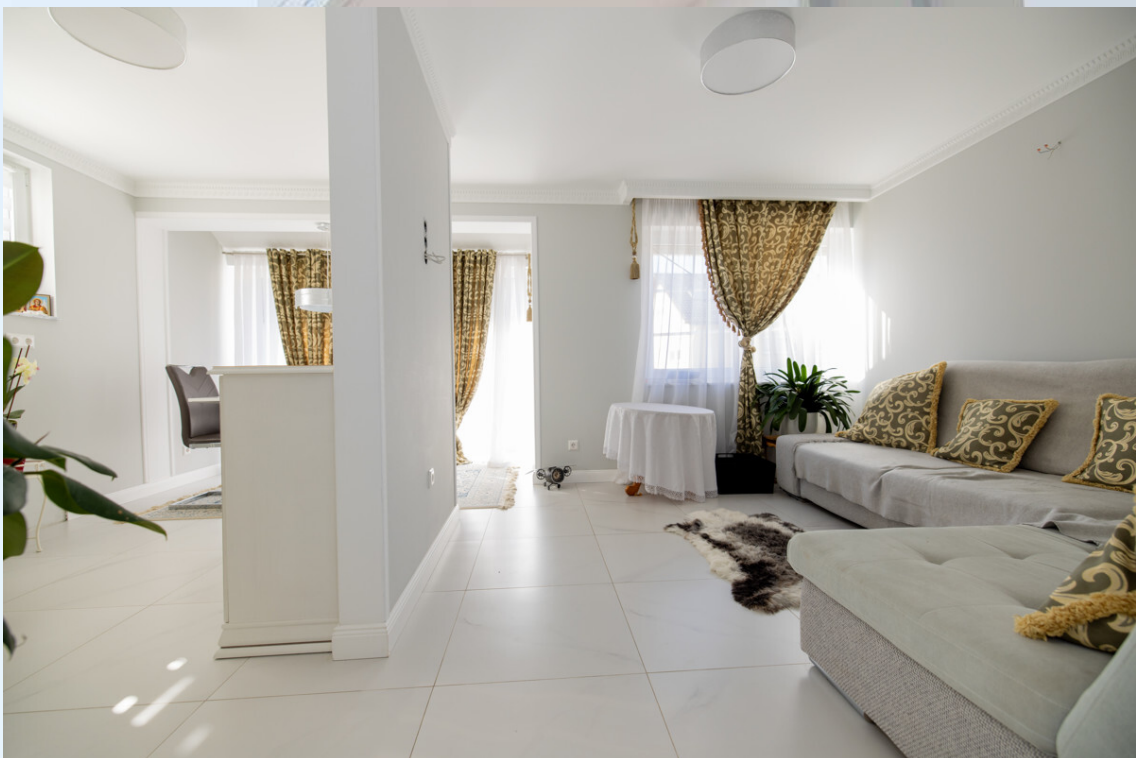
Wohn- und Esszimmer OG