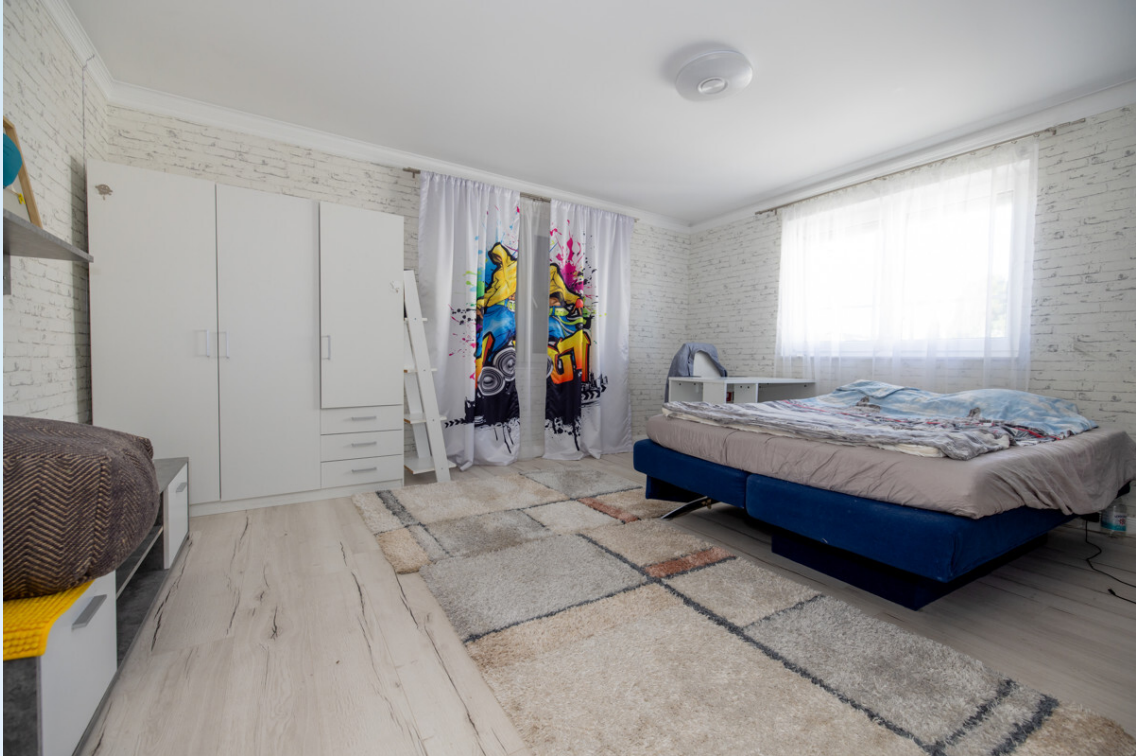
Schlafzimmer 1 0G