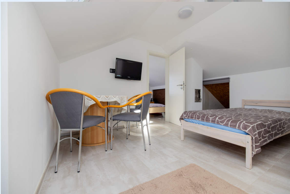
Wohn- und Esszimmer DG