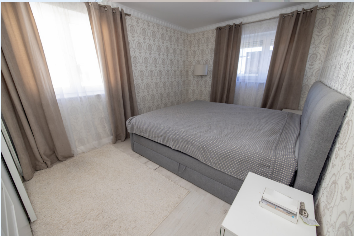
Schlafzimmer 2 0G