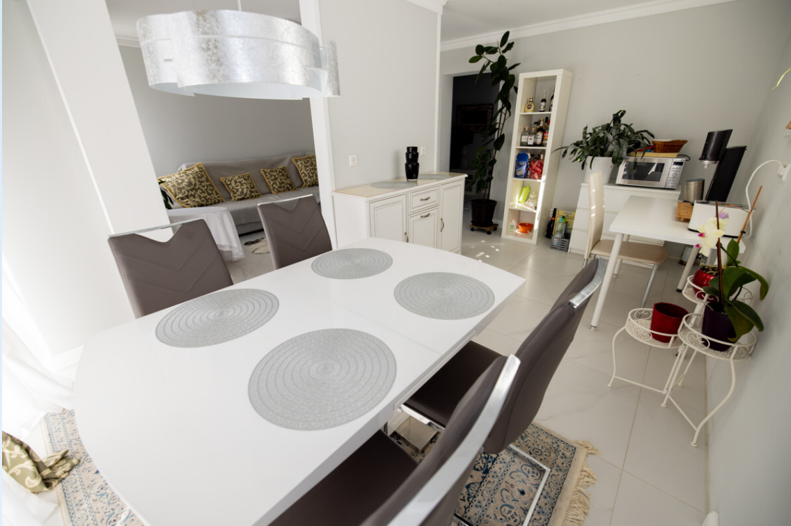
Wohn- und Esszimmer OG