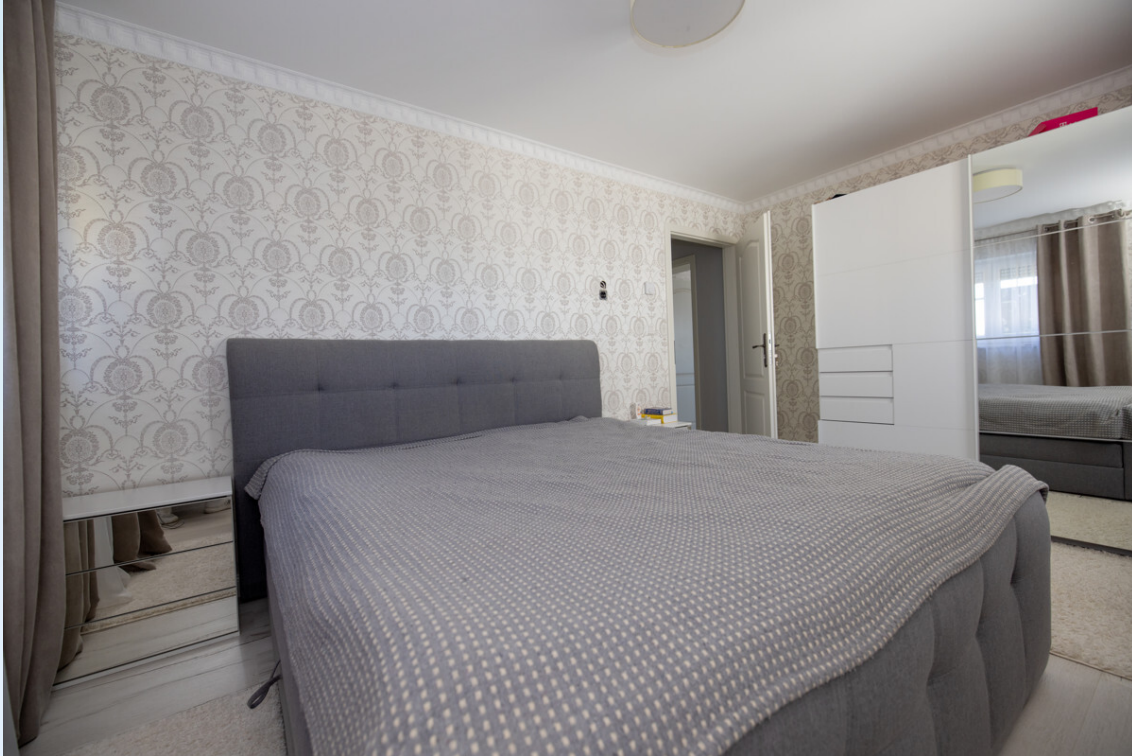
Schlafzimmer 2 OG