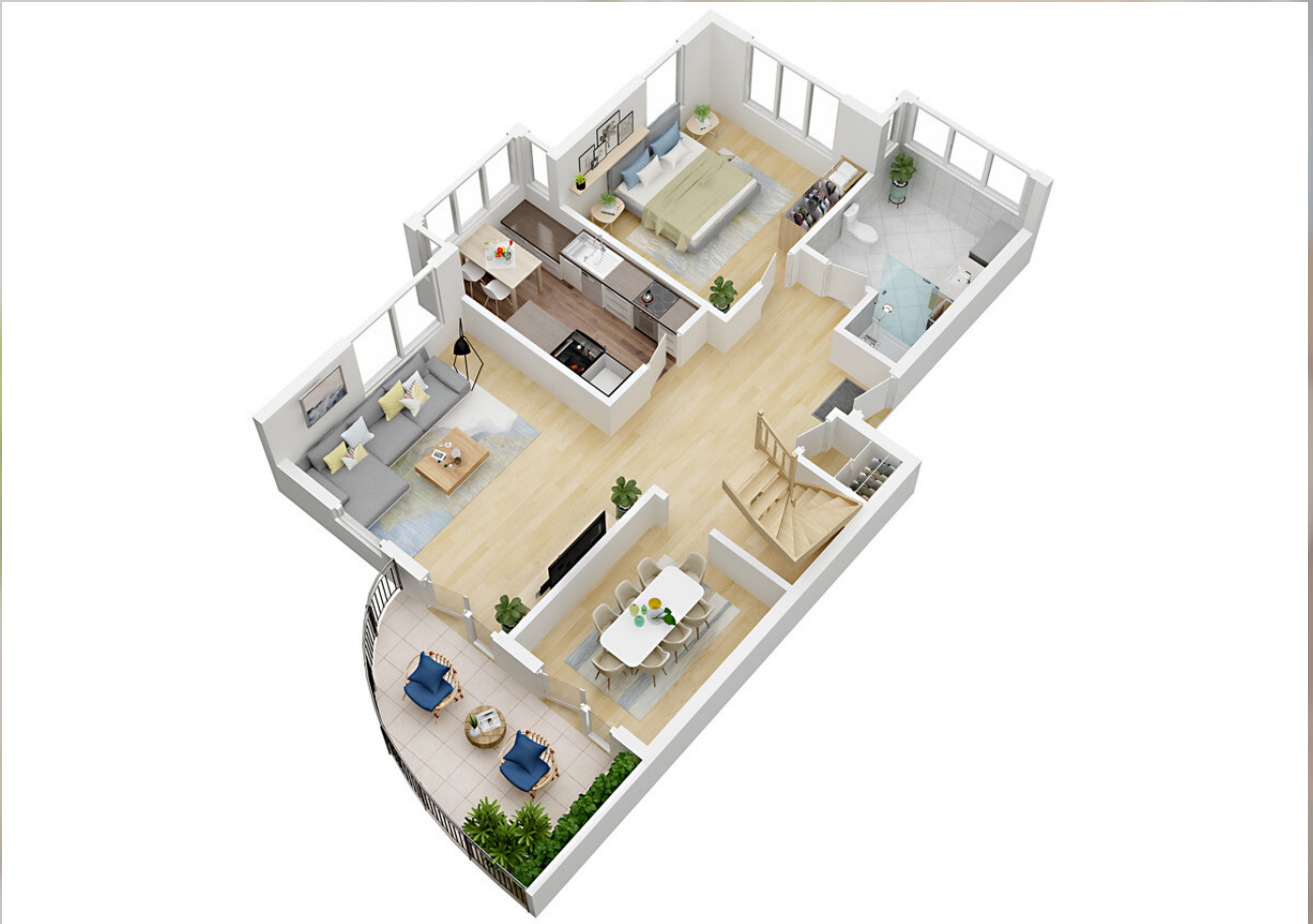
3D Grundriss 1. Stock