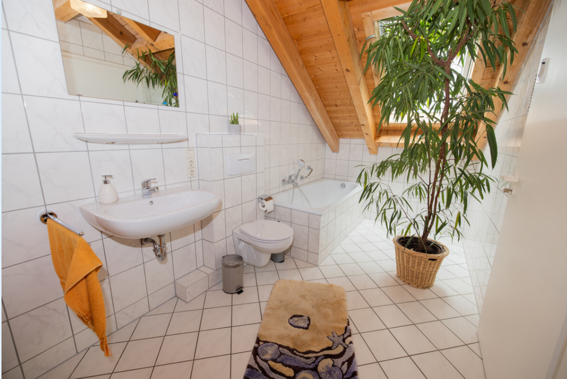
Bad mit Wanne