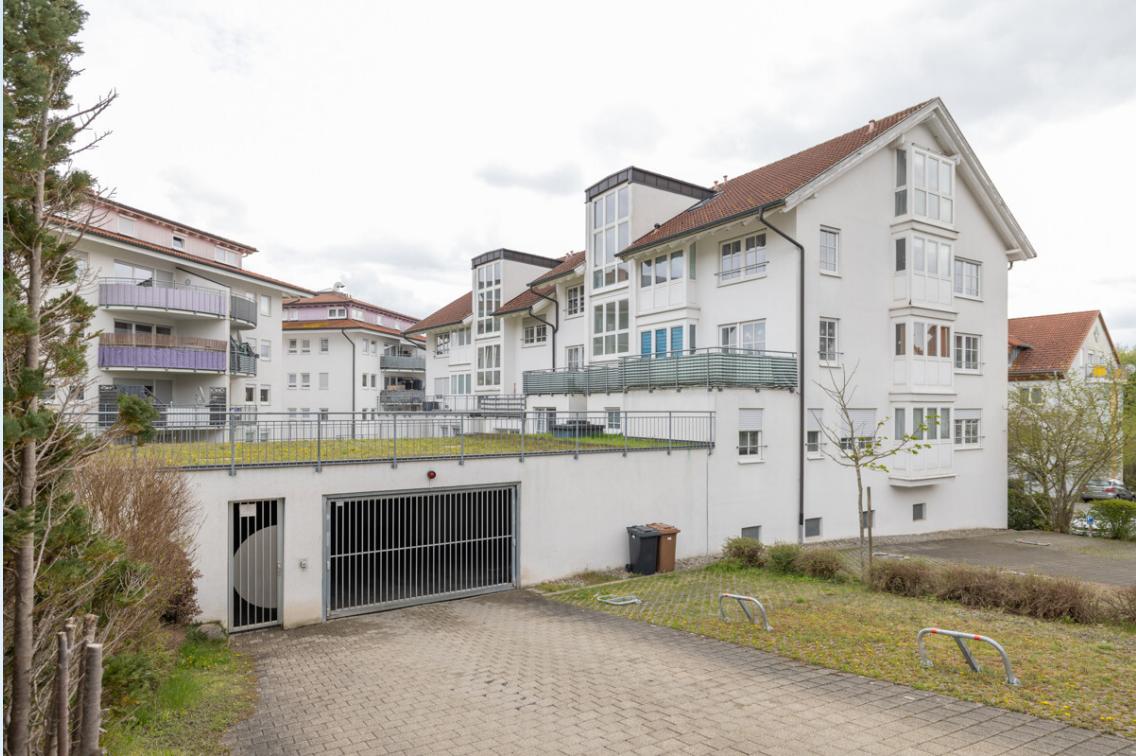
Zugang zur Tiefgarage