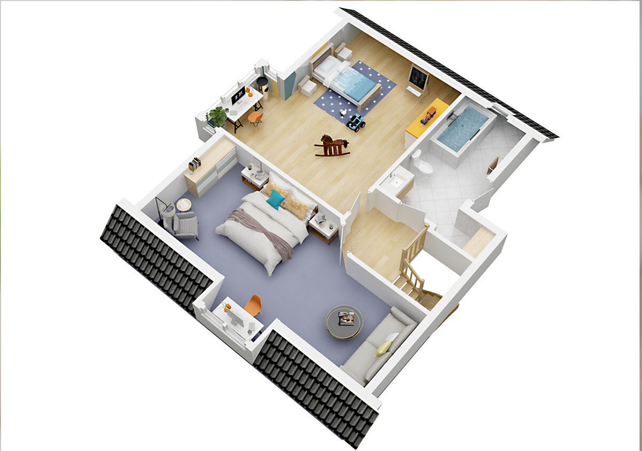
3D Grundriss 2.Stock