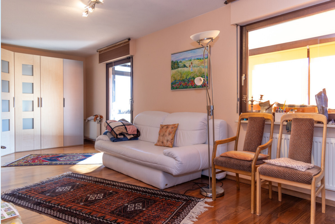
Schlafzimmer 2 EG