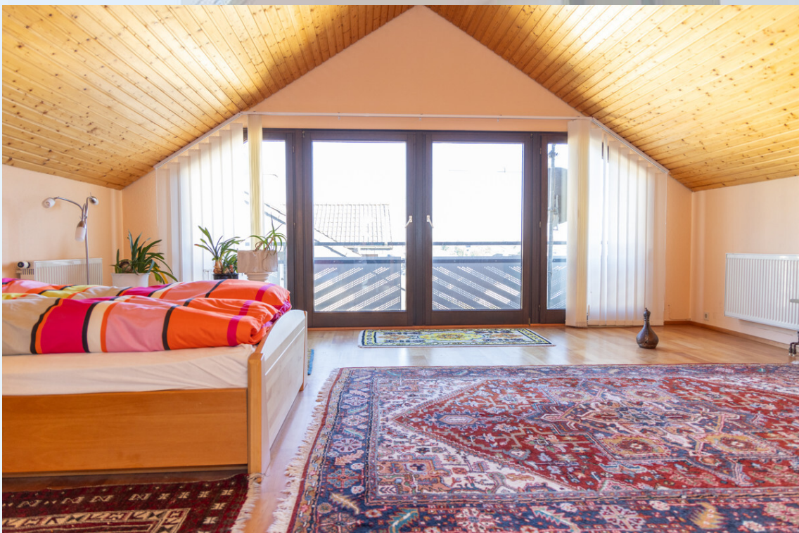
Schlafzimmer 3 DG