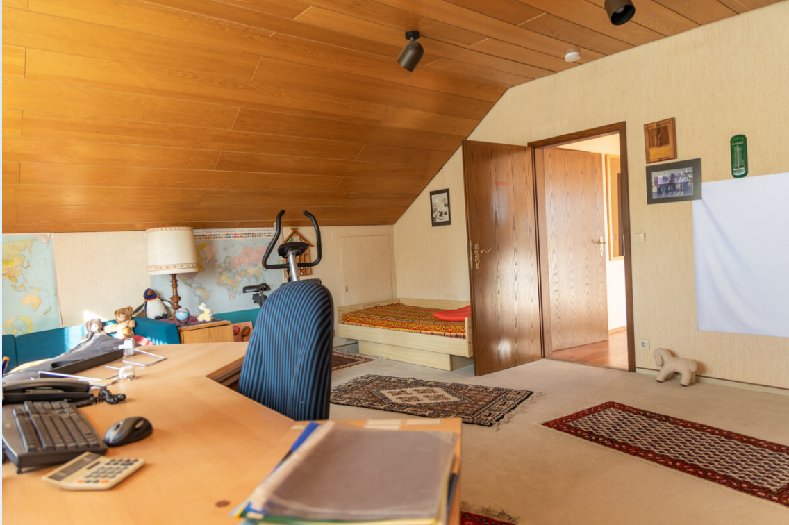
Schlafzimmer 2 DG