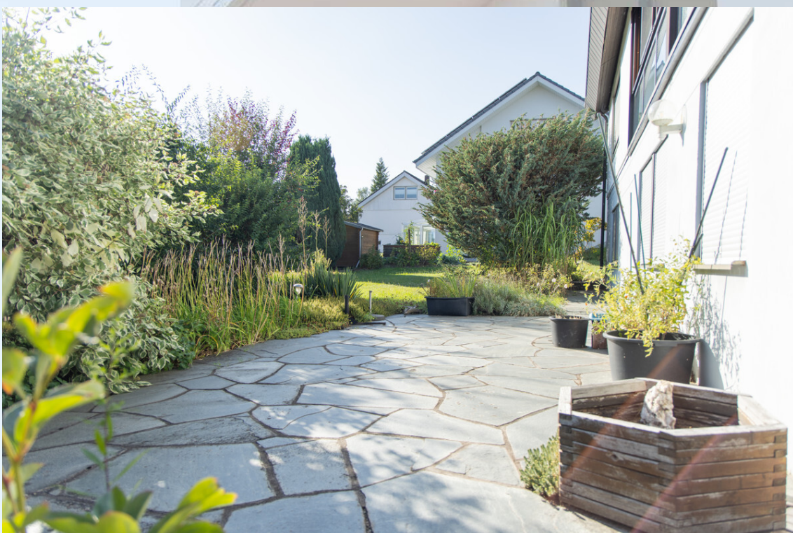
Terrasse / Garten