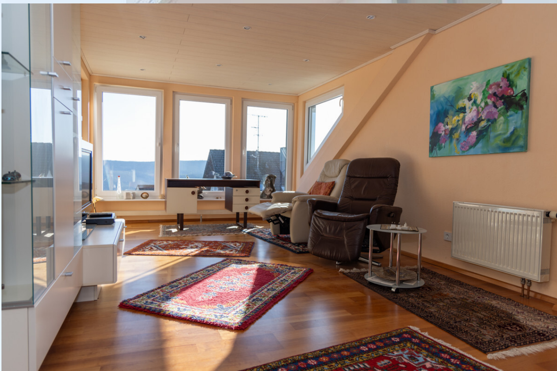
Schlafzimmer 1 DG