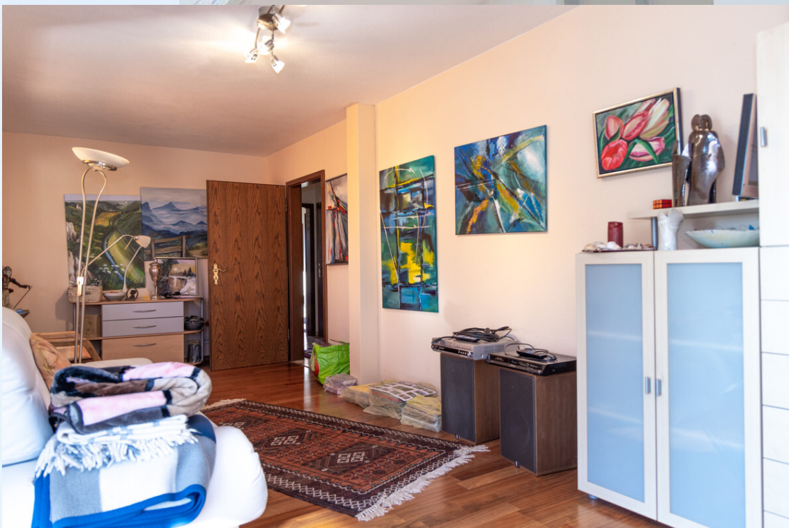
Schlafzimmer 2 EG