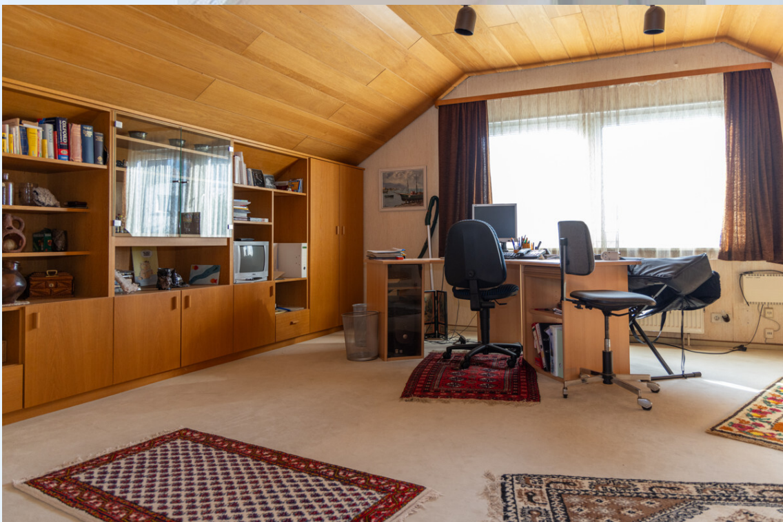
Schlafzimmer 2 DG