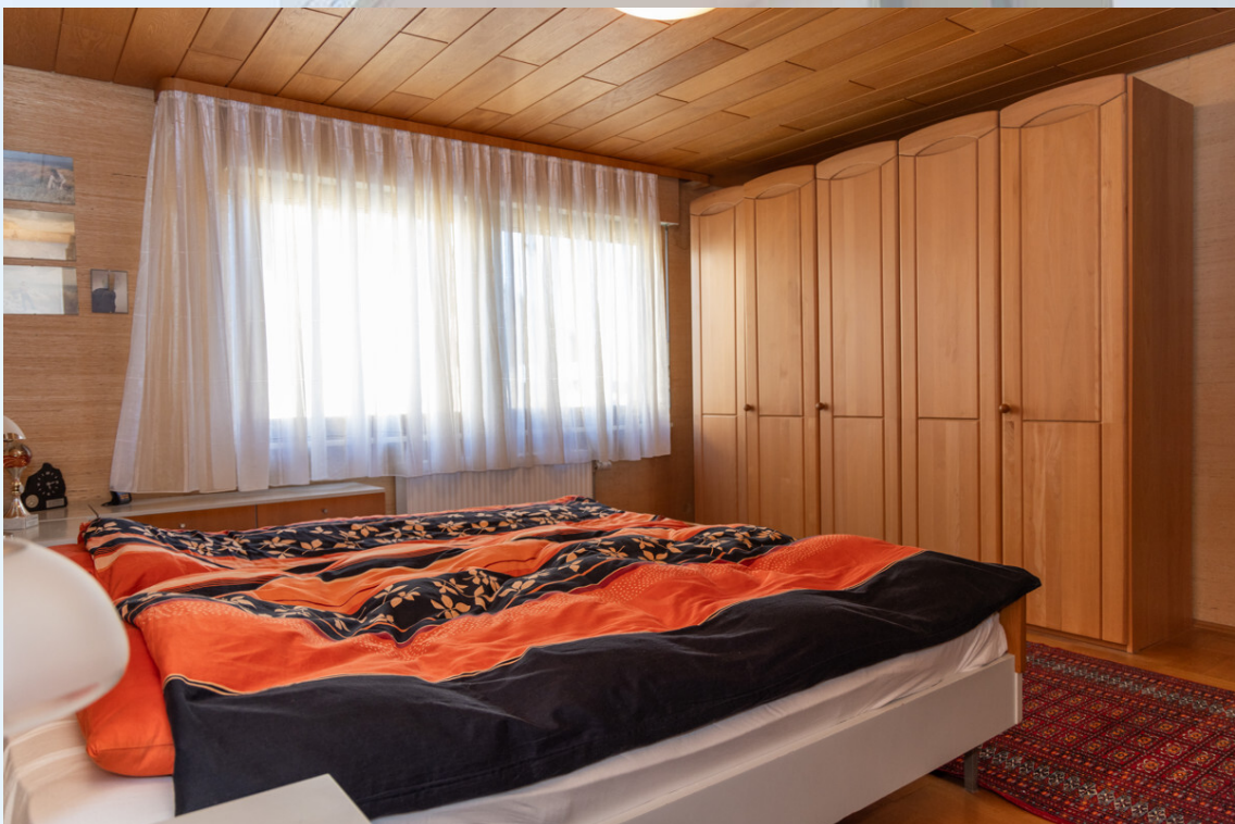
Schlafzimmer 1 EG