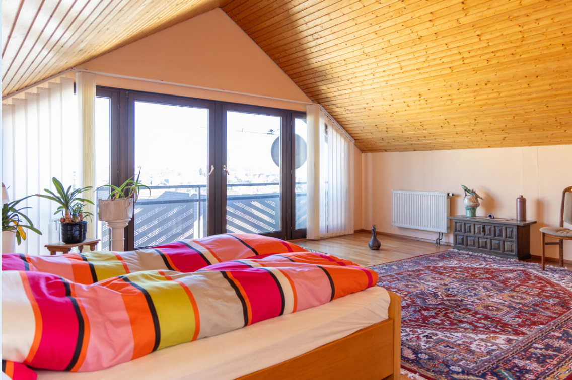
Schlafzimmer 3 DG