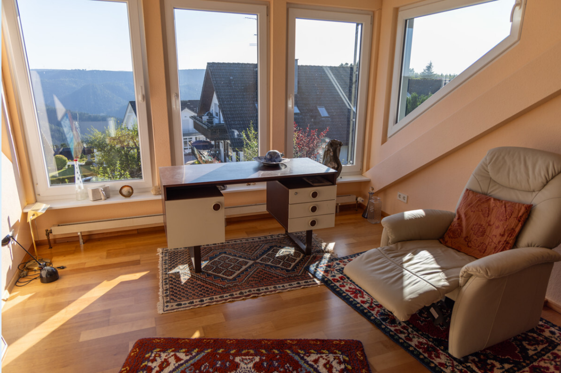
Schlafzimmer 1 DG