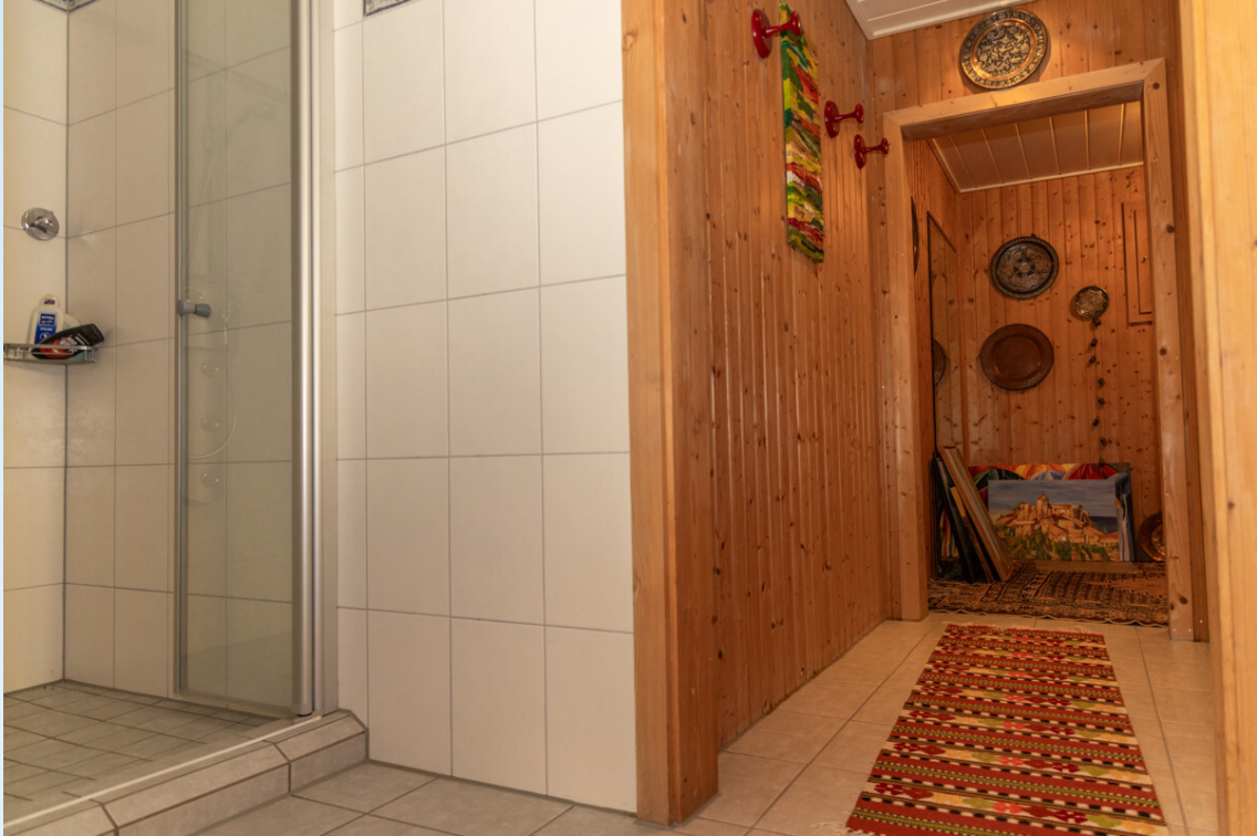
Dusche & Sauna