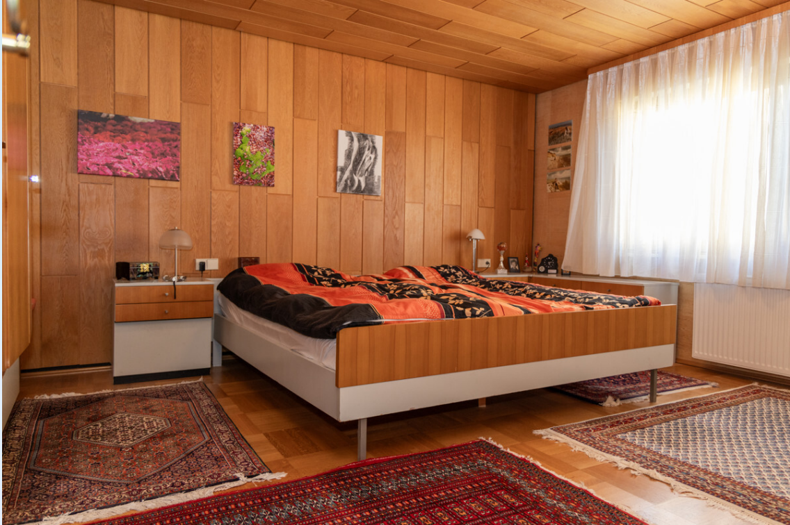
Schlafzimmer 1 EG