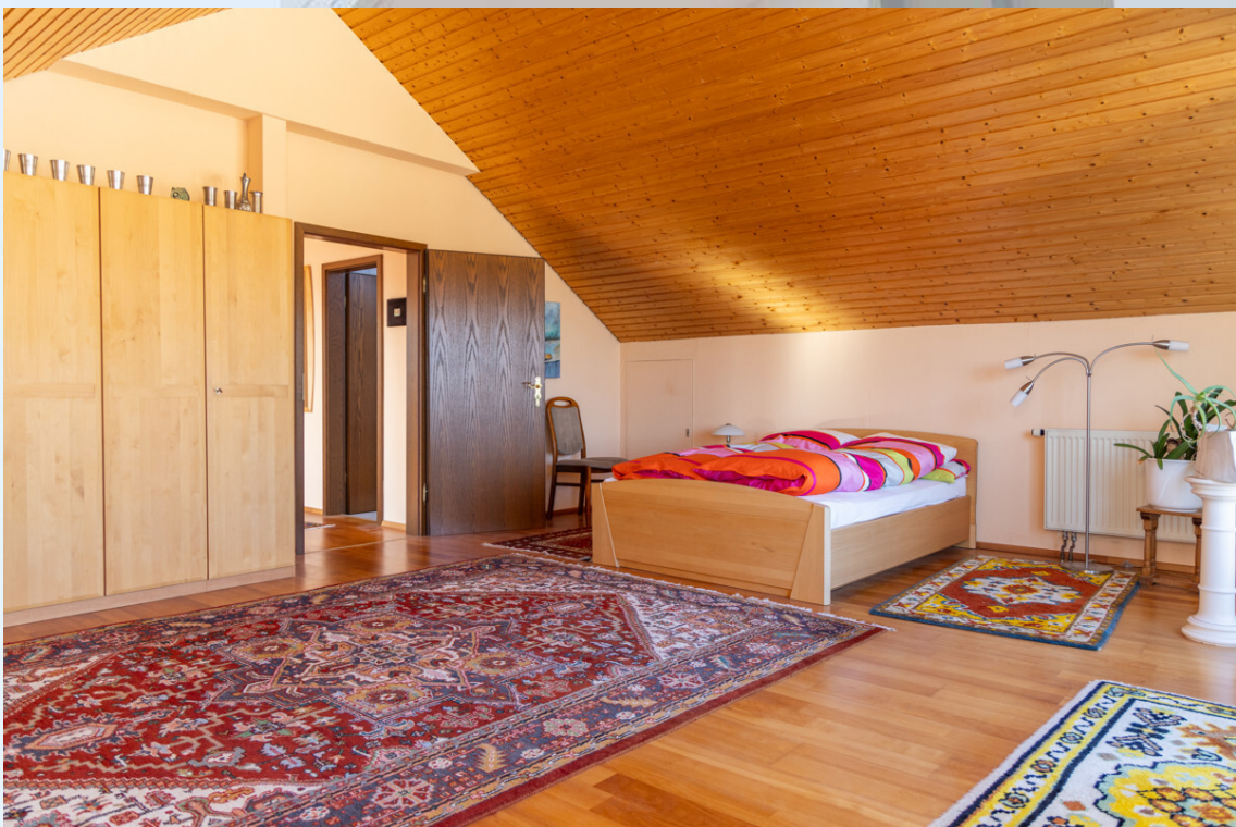
Schlafzimmer 3 DG